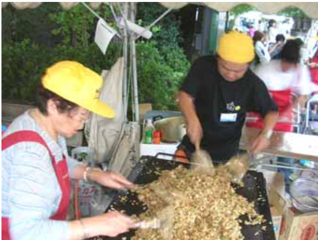
2006年9月23日 そばめし隊 in 早稲田

地域間交流として、防災講演会と長田名物そば飯を焼きに、早稲田地球感謝祭2006(主催：早稲田大学周辺商店連合会) 大久保祭り(大久保まつり実行委員会)に行きました。早稲田まちづくりサークル まっちワークや、大久保まちづくり関係者と協同行うことができました。