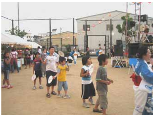
2006年8月8日 みすが盆踊り大会

御蔵のまちのこれからを考えるための調査・研究を行いました。町を見ながら再建状況を俯瞰する資料の作成を行いました。また、神戸大学工学部建設学科塩崎研究室の院生さん3人が、それぞれの論文にて御蔵のことを取り上げてくださっています。