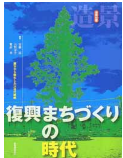
掲載誌 『復興まちづくりの時代』