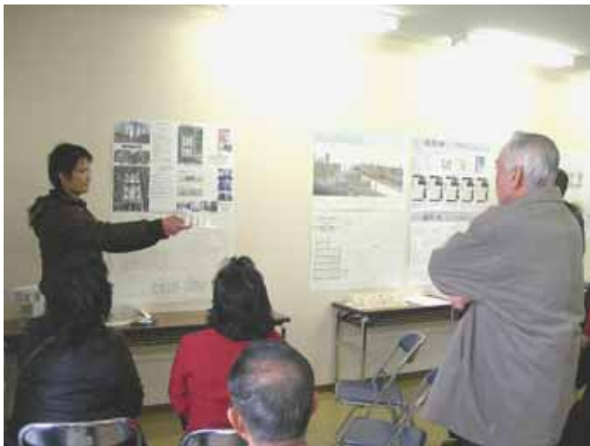
2006年2月5日 東大阪学生発表会

まち・コミは、今まで若江岩田関係で知り合っただいりんな資(志)源がうまく協働できるよう、模索しています。しかし学生は、地域で何ができるか、それぞれの立場で真剣に模索しています。こちらも初心を忘れず、まち・コミの今後として緊張が走ります。