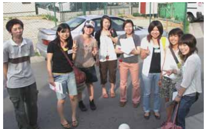
2006年8月専修大生復興誌ヒアリング

震災から12年、御蔵は大きな転換点を迎えました。他地区へ向けての活動や情報を共有し、御蔵地区の活動が少しでも活かせるようしっかり御蔵を見つめ直さないとはいけません。そのためにも初心に戻り、活動内容を振り返るための、事業誌等の必要性を感じるようになってきました。もう一度まちづくりを振り返り、進めてきました。良く見ていただき、叱咤激励よろしく願いいたします。